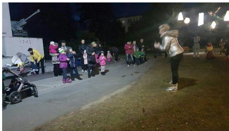
Slika 2: Pripovedovanje pravljice v soboškem parku v decembru 2016

Prav tako smo se v sodelovanju z Mestno občino Murska Sobota udeležili decembrskega praznovanja v parku, kjer so naše knjižničarke-pravljičarke otrokom učencem in staršem pripovedovale pravljice različnih junakov (Rdeča Kapica, Volk in sedem kozličkov, Trije prašički, itd.) ter različne praznične pravljice, ki so vsem popestrile torkov decembrski večer.