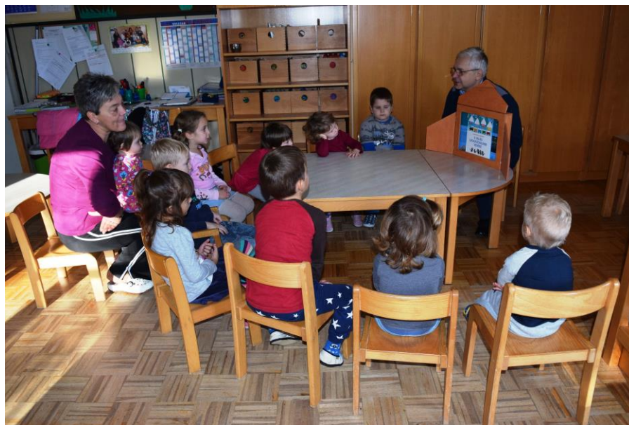
Slika 4: Pravljična ura z delavnico v vrtcu v Prosenjakovcih v novembru 2016

V okviru knjižnične vzgoje sta bili v dvojezičnih vrtcih v Prosenjakovcih in na Hodošu izvedeni pravljичni uri z delavnico z naslovom Najbogatejši vrabček na svetu .