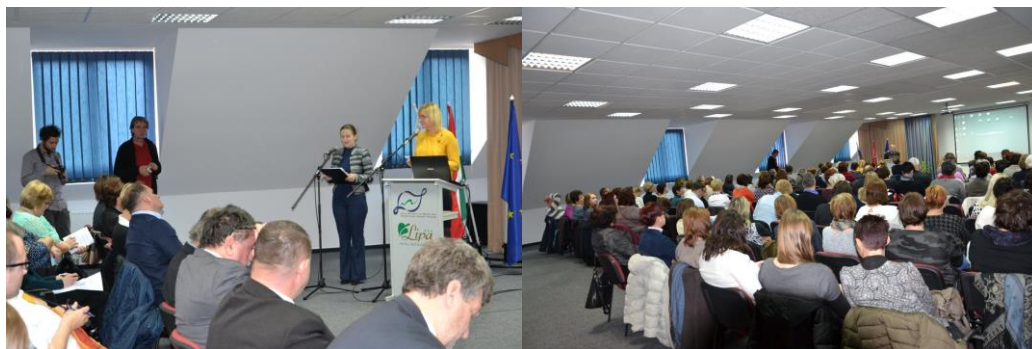
Slika 6: Mednarodna konferenca madžarsko-slovenskih knjižničarjev v Monoštru (14. 11. 2016)