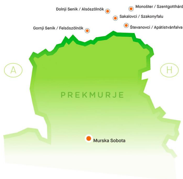
Slika 5: Postajališča porabske proge potujoče knjižnice