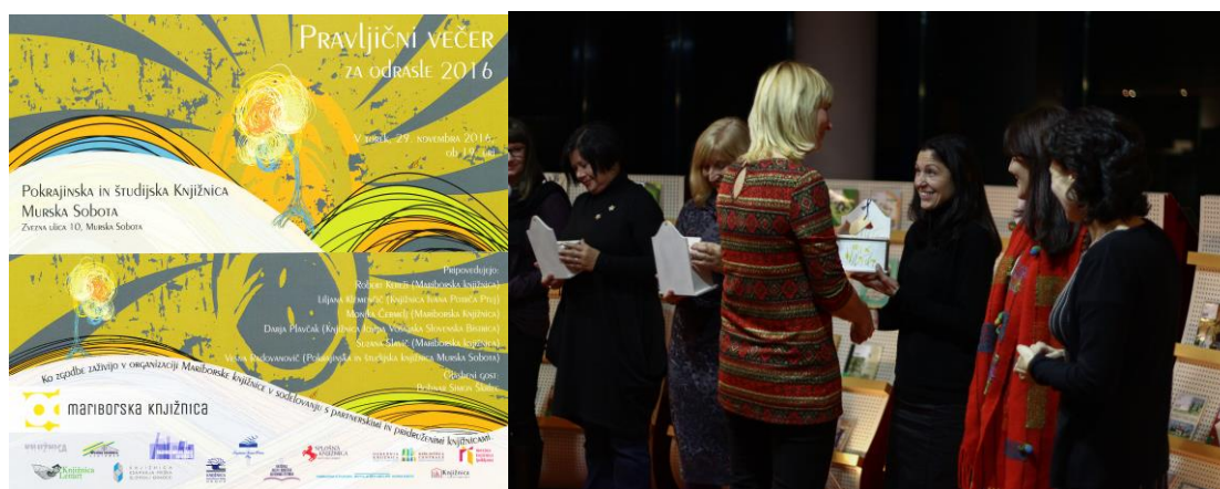
Slika 1: Vabilo in utrinek s pravljíčarkami za odrasle (29. 11. 2016)